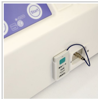
送信機（解凍器と接続）

※ CRYOSEAL® は旭化成メディカル株式会社の登録商標です ※ 各アップグレードは新規購入時でもご購入後でも実装可能です