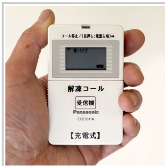
受信機（電波到達距離 40m）