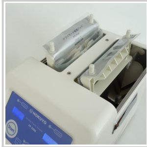
クリオ解凍パッドが2組付属

付属の"クリオ解凍パッド"にクリオ製剤を収納して解凍（所要時間約10分，最大4本） CRYOSEAL®SYSTEM（旭化成メディカル）解凍実績あり（所要時間25分，最大4組）